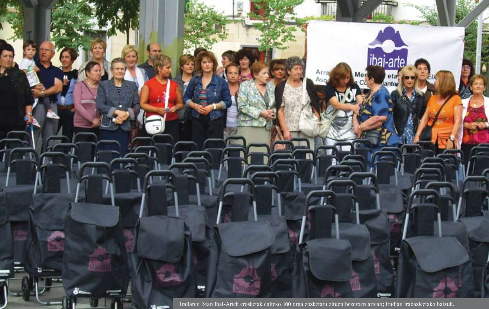
Irailaren 24an Ibai-Arteek erosketak egiteko 100 orga zozketatu zituen bezeroen artean; irudian irabazleetako batzuk.