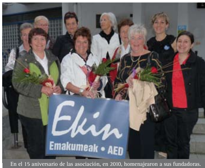
En el 15 aniversario de las asociación, en 2010, homenajearon a sus fundadoras.