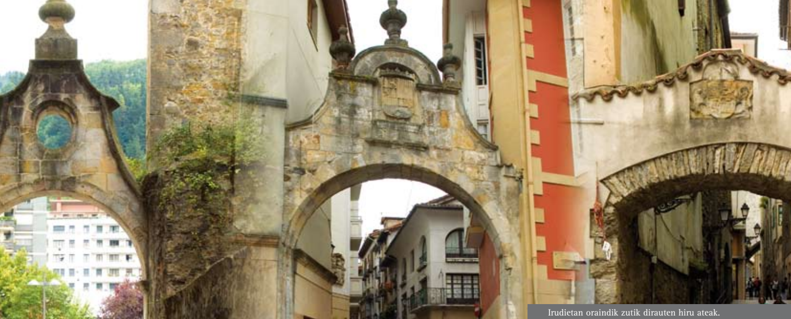
Irudietan oraindik zutik dirauten hiru ateak.