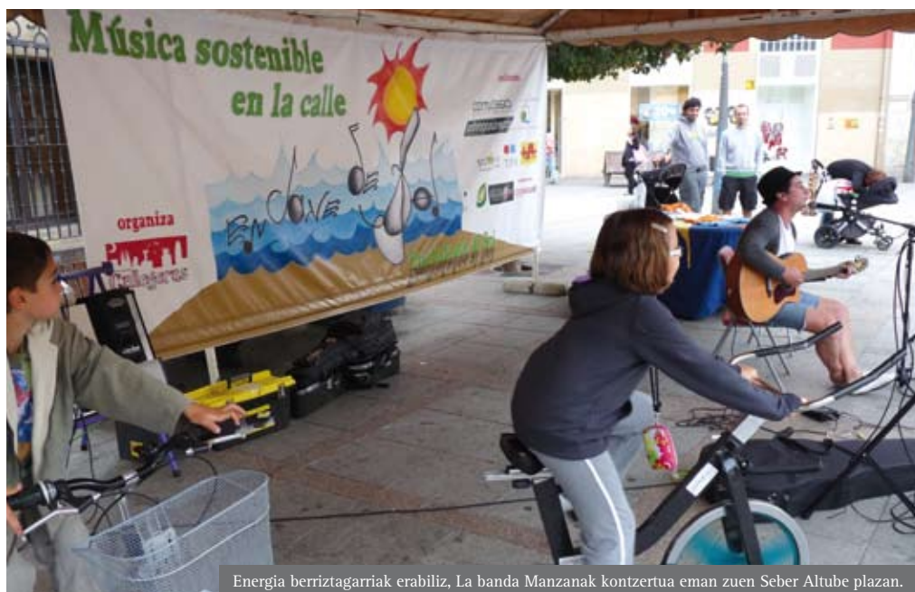
Energia berriztagarriak erabiliz, La Banda Manzanak kontzertua eman zuen Seber Altube plazan.