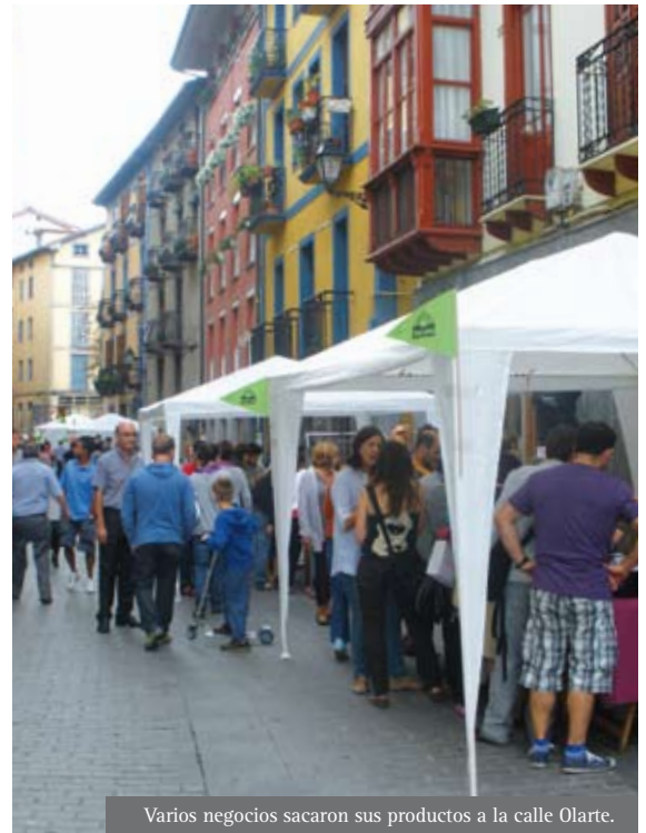
Varios negocios sacaron sus productos a la calle Olarte.

En 2011 Ibai-Arte ha doblado su apuesta y en vez de una, ha organizado dos ferias en el mismo ejercicio. Los resultados han sido muy buenos, como para ser repetidos: en febrero participaron 32 comercios y en septiembre 27.