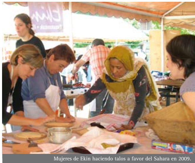
Mujeres de Ekin haciendo talos a favor del Sahara en 2009.

Para cumplir esos objetivos, a medio plazo Ekin realizará entre otras las siguientes actividades: taller de manualidades, cursillo de reciclaje de ropa, cursillo de defensa personal, conferencia sobre sexología, conferencia histórica sobre las vestimentas de las mujeres del País Vasco, taller de costura para realizar un traje típico vasco, "Módulo de recepción y formación para mujeres inmigrantes y personas en situación de rechazo social" y servicio de maternidad. ■