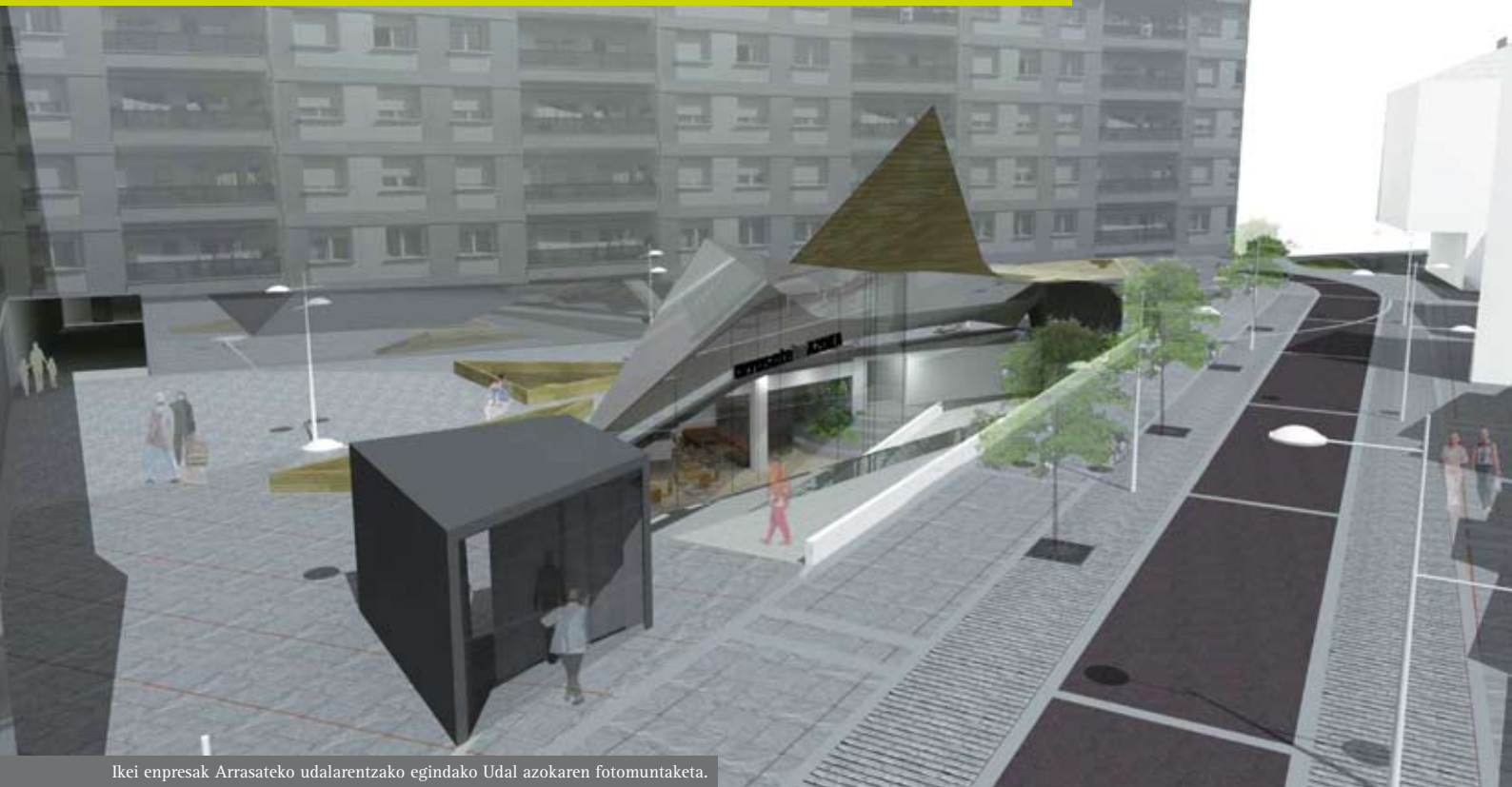
Ikei enpresak Arrasateko udalarentzako egindako Udal azokaren fotomuntaketa.