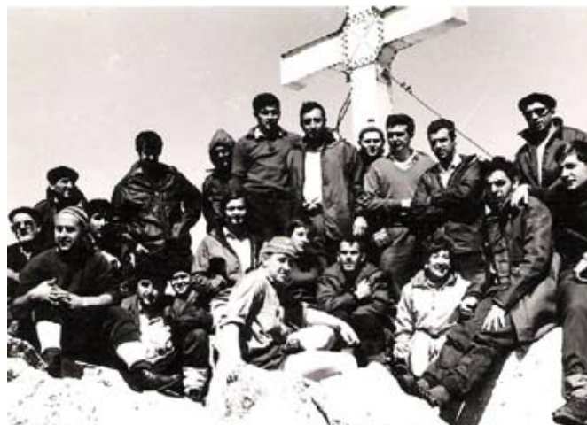
Besaidek antolatutako lehenetariko irteera, 1968an Anetora.

Edonork Besaidera jo nahi badu, Garibaian duten lokalean martitzenero eta eguaztenero 19:30etik 20:30era bitartean egiten dute harrera. Bertan bazkide edo federatu txartela egiteaz gain, aukera dago liburuak mailegatzeko edo mendi materiala alokatzeko. ■