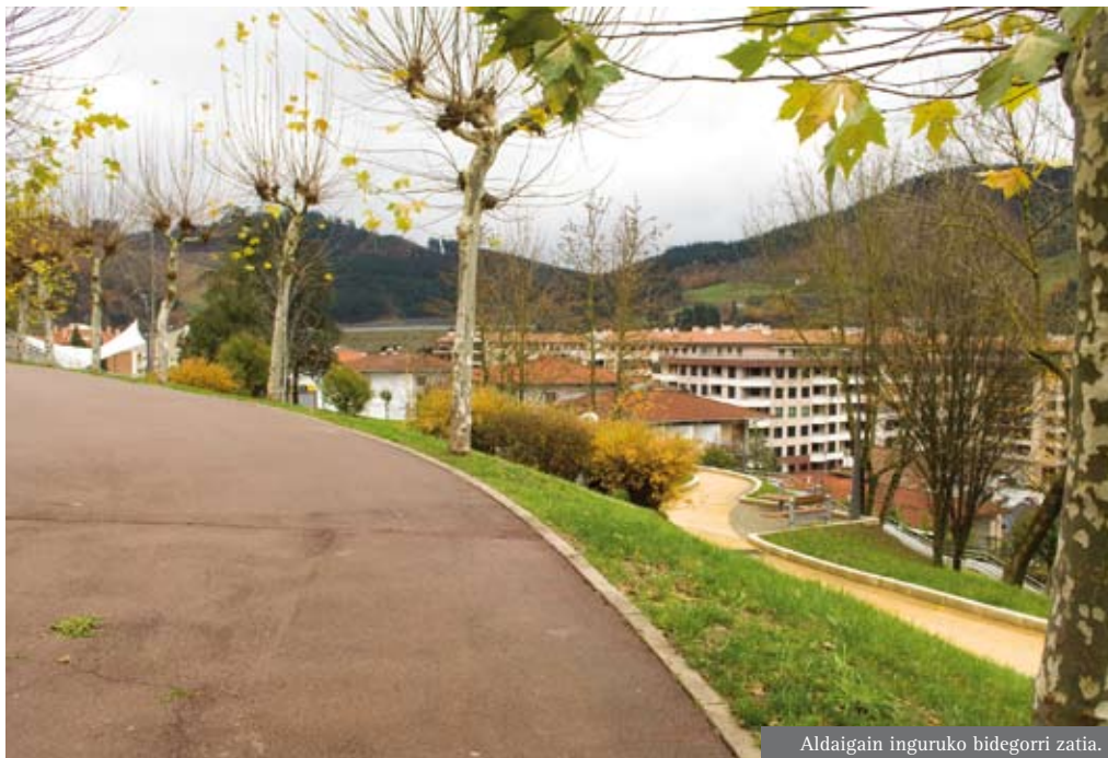
Aldaigain inguruko bidegorri zatia.

Arrasatek Elorregi edo San Prudentziora bitarteko zatia osatzen duen bidegorria izan zen lehena. Zerbait herritarrek erabiltzeko ohitura hartu zuten, nahiz eta landaretzaz beteta egon eta basati samarra zen. Gerora etorri ziren beste ibilbide batzuk, eta herrigune guztia alderik alde zeharkatzen duen Gernika Oinezkoen Zumardia, besteak beste. Azken honek, Gernika Oinezkoen Zumardiak sekulako aldaketa ekarri zuen: herritik irten gabe aukera aproposa eskaini die herritar askori. ■