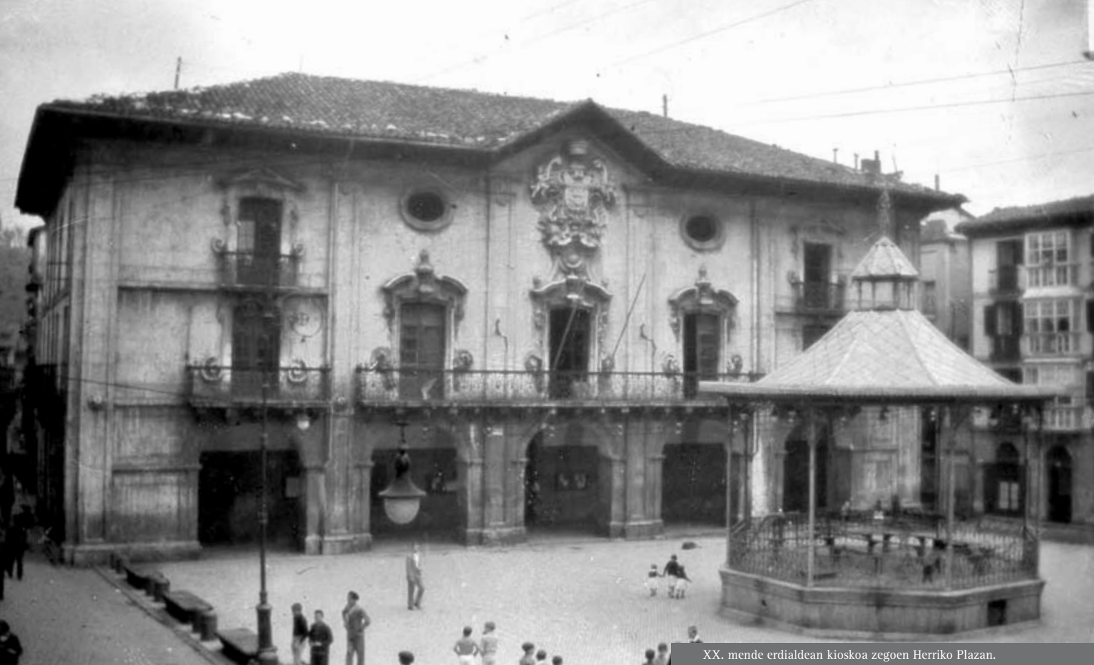
XX. mende erdialdean kioskoa zegoen Herriko Plazan.