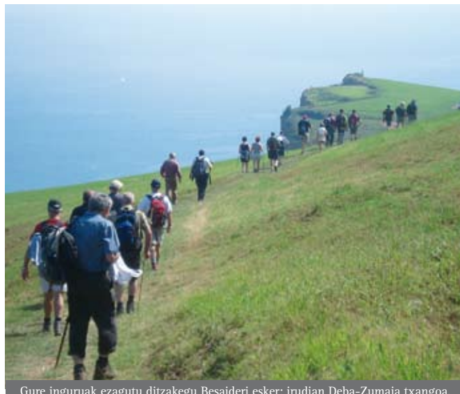
Gure inguruak ezagutu ditzakegu Besaideri esker; irudian Deba-Zumaia txangoa.

”1986an Euskal Herriko mendi talde garrantzitsuenetakoa zen, 1.051 bazkiderekin”